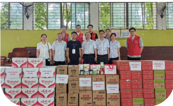
7月7日,中国工商银行岳阳分行派员前往华容县洲垸临时安置点送物资,帮助当地群众渡过难关。