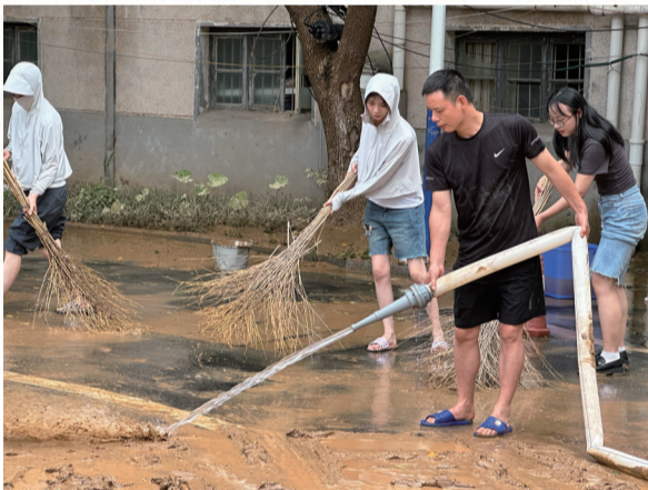
洪水退去后,中国工商银行平江支行党员干部开展重修重建工作,排污水、铲泥沙、洗地板,以最快速度恢复网点正常营业。