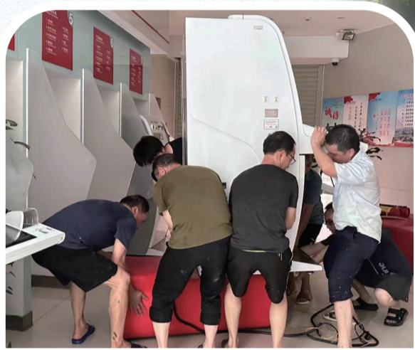
7月1日,中国工商银行平江支行负责人带领员工将网点内设备设施垫高,抵御洪水侵袭。