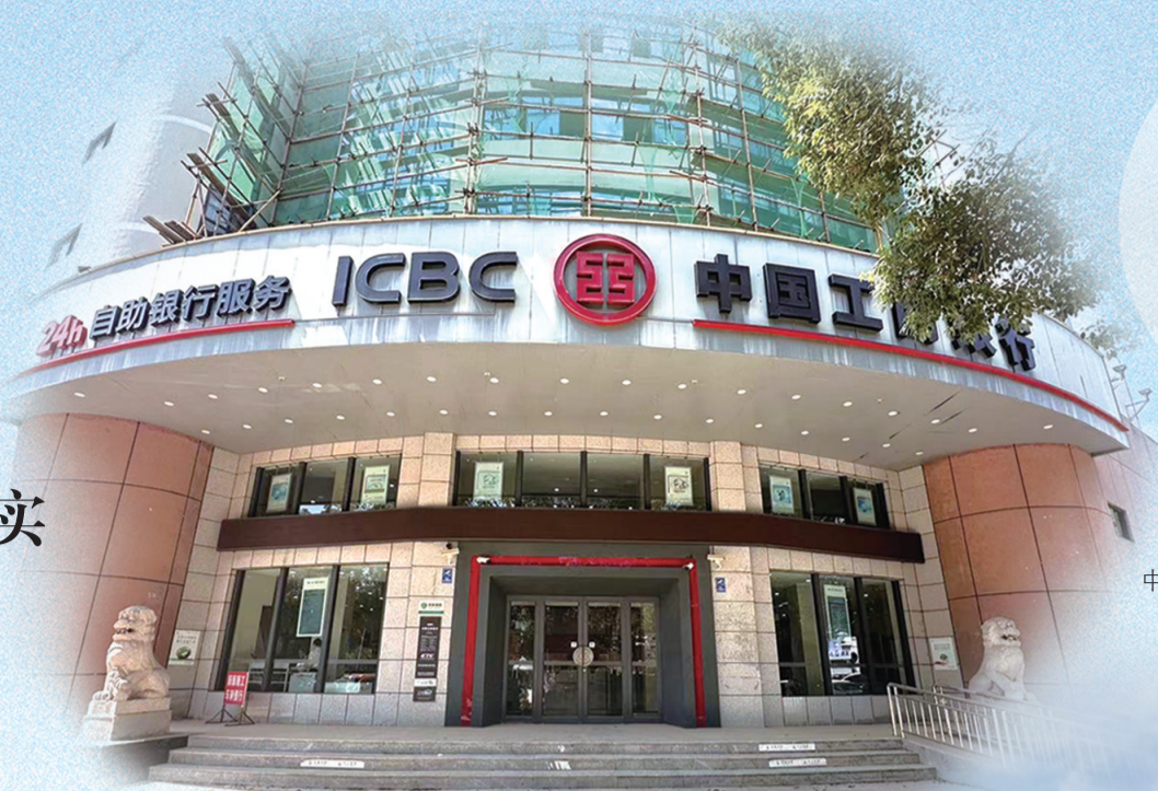
灾后恢复正常厅堂服务的中国工商银行平江支行。

华容支行了解客户诉求后,第一时间和上级行沟通协调,在不违反该行制度的前提下,通过身份证加辅助材料的形式,成功为客户办理一笔19万元的取款业务用于房贷归还,解决客户燃眉之急。该客户对支行工作人员的尽心帮助连声道谢,办理完业务又匆匆赶往抗洪一线。