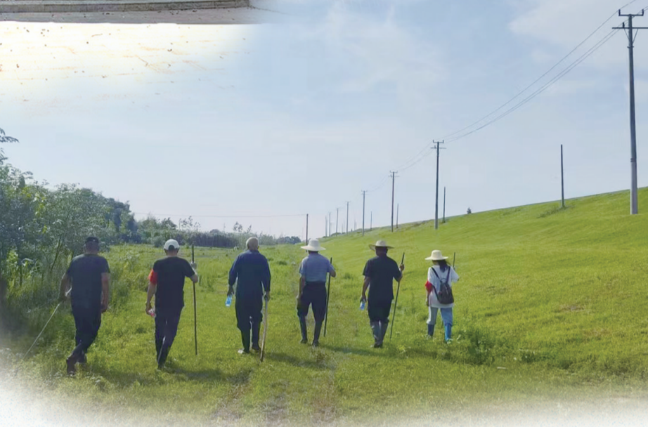
中国工商银行汨罗支行党员干部面对巡堤查险工作,冲锋在前,守护第一防线。