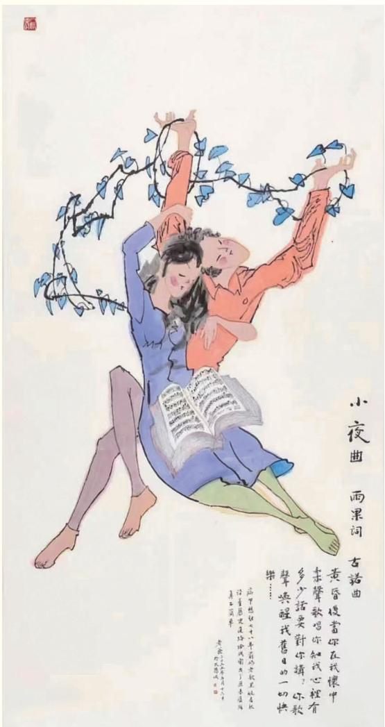
《小夜曲》纸本设色 138cmx69cm 2023

2015年,黄永玉先生开始筹办自己的百岁画展,“很认真地在做这件事”。因为生命之神出了错,先生没来得及完成。