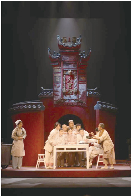
花鼓戏《火宫殿》剧照。

小时候,我曾在奶奶家的老式电视机前,看过花鼓戏。那时的我,对那繁华华丽的戏服、五彩斑斓的妆容以及悠扬婉转的唱腔感到困惑。我看不懂剧情,也听不懂唱腔,只觉得它沉闷无趣,让我昏昏欲睡。然而,近日,当我踏入剧场,亲眼目睹现代花鼓戏《火宫殿》的演出,我彻底改变了对花鼓戏的刻板印象,被其艺术魅力所感染。