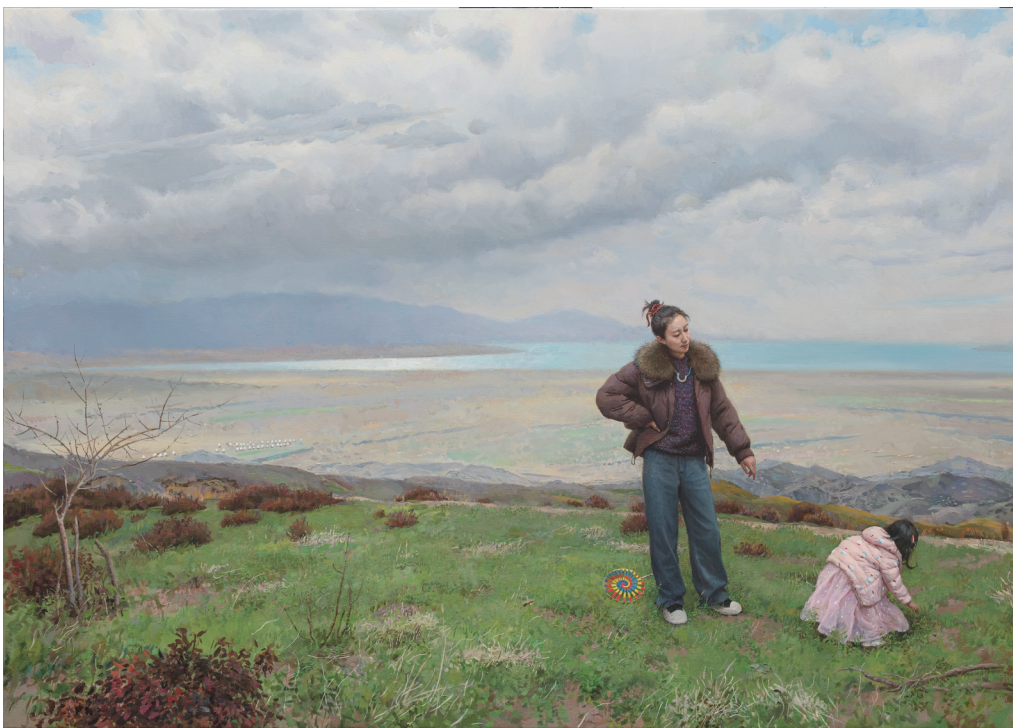
《阿拉湖》135cmx200cm 布面油画 2023—2024

百余年来,最初诞生于欧洲的油画艺术,在近现代中国几代艺术家与美术教育家的共同努力下,已成为我国造型艺术门类中最具典型意义并融民族风格的主要画种。