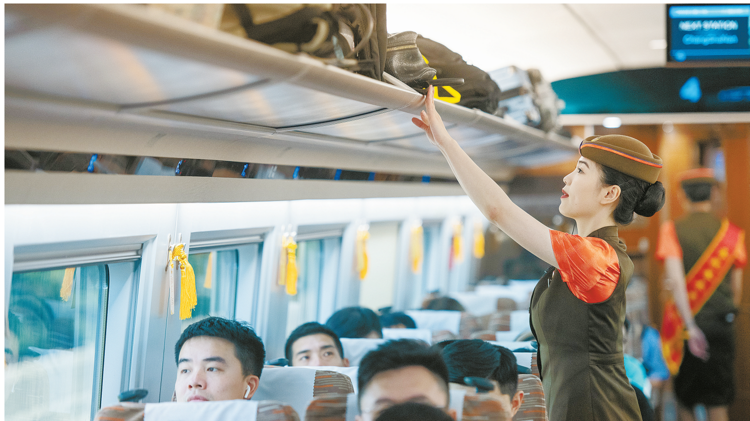
6月15日,在武汉至深圳北的G875次列车上,乘务员在整理行李架。

截至目前,我国已有京沪高铁、京津城际、京张高铁、成渝高铁、京广高铁等线路建成安全标准示范线,复兴号动车组列车按时速350公里高标运营的高铁营业里程达到6798公里。