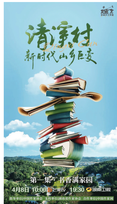
纪录片《清溪村——新时代山乡巨变》海报。

4月8日起，由中国作家协会、国家广电总局宣传司、湖南省委宣传部指导，芒果TV制作的6集纪录片《清溪村——新时代山乡巨变》在湖南卫视、芒果TV播出。纪录片聚焦益阳高新区谢林港镇清溪村，展现乡村振兴“清溪模式”的生动实践和丰硕成果，为新时代提供了文学助力乡村振兴的典范样本。