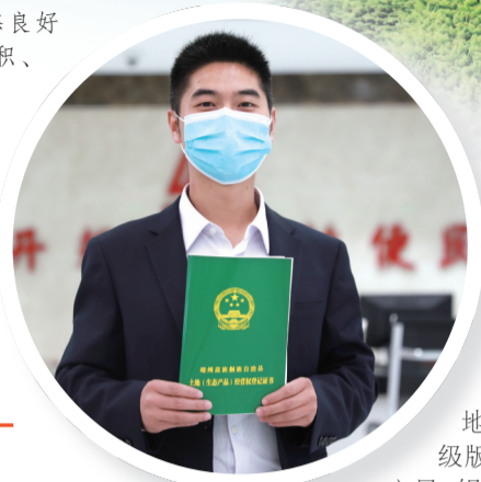
▲ 渠阳镇南竹林海。 ▲ 靖州苗族侗族自治县在全省首创生态产品经营权登记。

人不负青山，青山定不負人。作为湖南省深化集体林权制度改革唯一试点市，怀化勇毅前行，借力林改激荡春风，持续提升林改“怀化样本”，成就了绿水青山，富裕了万千林农，勾勒出一幅幅山乡巨变、锦绣斑斓的新画卷。