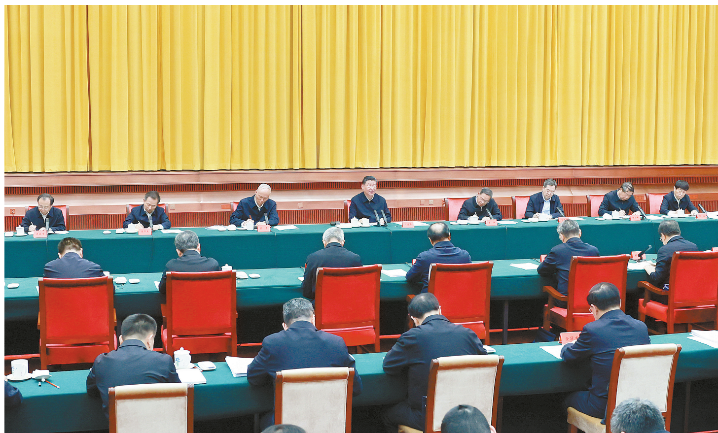
3月20日下午,中共中央总书记、国家主席、中央军委主席习近平在湖南省长沙市主持召开新时代推动中部地区崛起座谈会并发表重要讲话。 本版照片均为新华社发