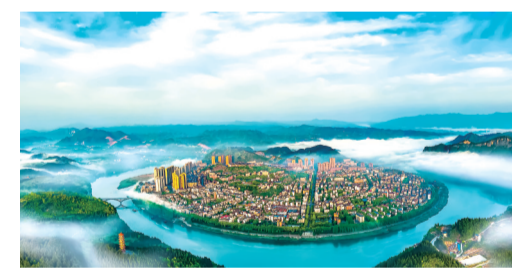
氧吧之城，泸溪白沙。