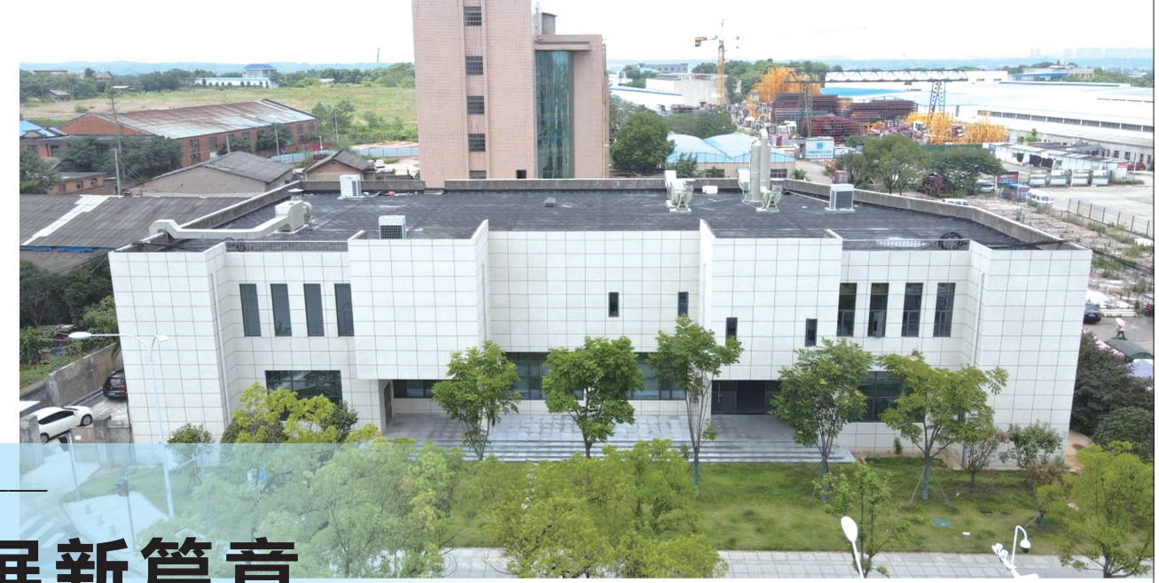
生态地质实验室外景。

在“双联”带动下，省生态所及中核公司按照省地质院“一体两翼三支撑”发展战略部署，在生态保护修复、生态环境调查监测、地理信息测绘等技术含量较高、产业附加值较高的领域着重发力，经营业绩稳定增长。据统计，省生态所2023年生态环境业和地质技术服务业收入同比增长25%以上，大地质主营业收入占比近70%。