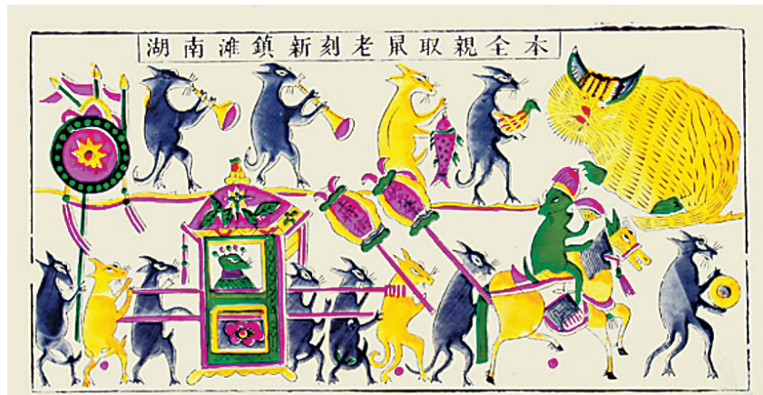
滩头年画(老鼠娶亲)。