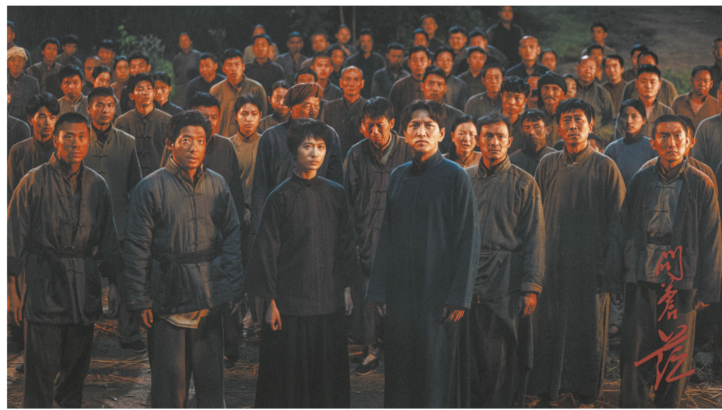
电视剧《问苍茫》剧照。

感谢各界给予《问苍茫》的支持和认可,让我从一个创作者的角度,感受到文化自信、历史自信,让我对历史题材创作充满了信心和希望。