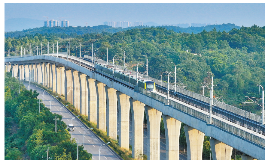
2023年8月14日,长株潭城际轨道交通西环线,地铁列车准备驶入坪塘站。6月28日,长株潭西环线一期工程正式开通运行,长沙、湘潭首次实现地铁系统跨城市互联互通。