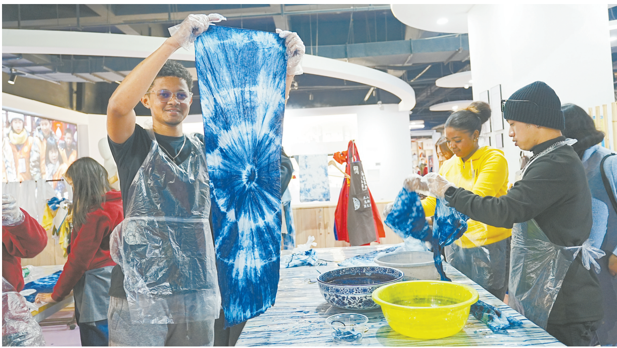
外国留学生在湖南雨花非遗馆学习扎染。(资料照片)