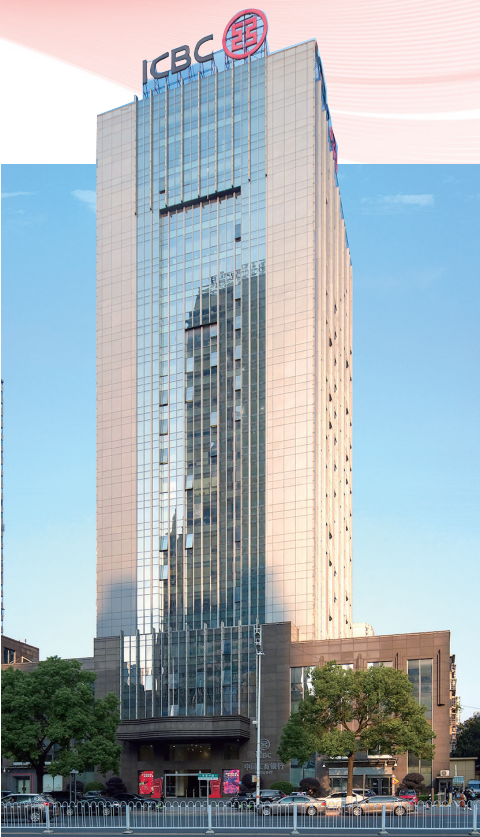
工商银行湖南省分行。

民银行湖南省分行搭建的企业收支流水大数据征信平台，基于企业交易流水、金融资产、融资情况等数据，结合银行其他可获得数据，建立客户筛选、授信和风控模型，采用“线上申请+线下核实”模式为省内小微企业提供的普惠融资服务。该金融产品将于本月末正式投产，有望成为工商银行湖南省分行普惠性最强、智能化程度最高的分行特色融资场景。