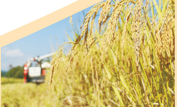
9月,衡东县杨林镇水稻丰收。

9月15日至17日,第二届湖南旅游发展大会在郴州成功举办。在筹备和举办大会期间,郴州市新引进重大文旅项目16个,总投资91.3亿元。其他13个州市全年共推进重点项目337个,总投资2058.61亿元,形成了“一地举办、全省联动、百花引领、百景争艳”的生动局面。出台“文旅20条”,深入实施“游客满意在湖南”行动计划,全省发放文旅消费券1亿元,株洲“厂BA”、歌曲《走,去永州》等火爆出圈。