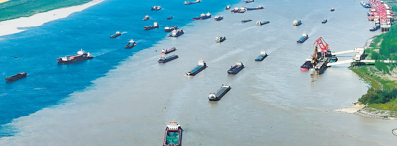
4月8日,洞庭湖与长江交汇处,城陵矶港附近的水面上船舶往来穿梭,码头上货物装卸繁忙有序。

10月12日,全球直径最大、单体最重、承载最高的整体式盾构机主轴承在长沙下线。把握科技创新根本动力、数字经济重大趋势、绿色低碳生态底色,湖南制造的“含新量”“含智量”“含绿量”不断提升。48个制造业关键产品“揭榜挂帅”项目累计突破关键技术109项;新入选国家智能制造示范工厂揭榜单位13家、优场景景25家,新建智能制造企业904家,智能制造产线(车间)1470条、智能工位9561个;累计培育国家绿色工厂213家,绿色园区18家,绿色发展综合水平排全国第6位,创近年来新高。