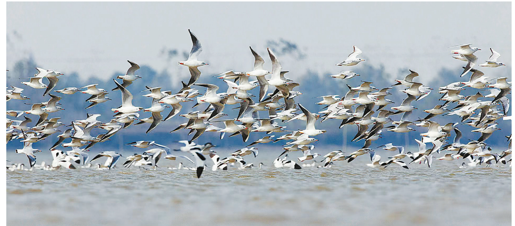
11月16日,东洞庭湖国家级自然保护区,一大群红嘴鸥在水中觅食。

聚焦打好经济增长主动仗、科技创新攻坚仗、优化营商环境持久仗、防范化解风险冲击仗、安全生产翻身仗、重点民生保障仗,全年经济运行保持稳中有进、进中提质的向好势头。出台稳增长20条、促消费20条、文旅振兴20条,以及工业领域18项支持措施、防风险20条、民营经济发展30条等举措,有力稳定社会预期、提振发展信心,规模工业、消费、经营主体等指标实现较快增长。省重点建设项目超额完成年度投资计划,“宁电入湘”工程开工,平江电厂、华容电厂、五强溪扩机工程等项目顺利投运,夯实高质量发展的电力支撑。国有“三资”清查处置管理改革等纵深推进,“湘易办”超级服务端上线服务超1.7万项,营商环境向上向好。