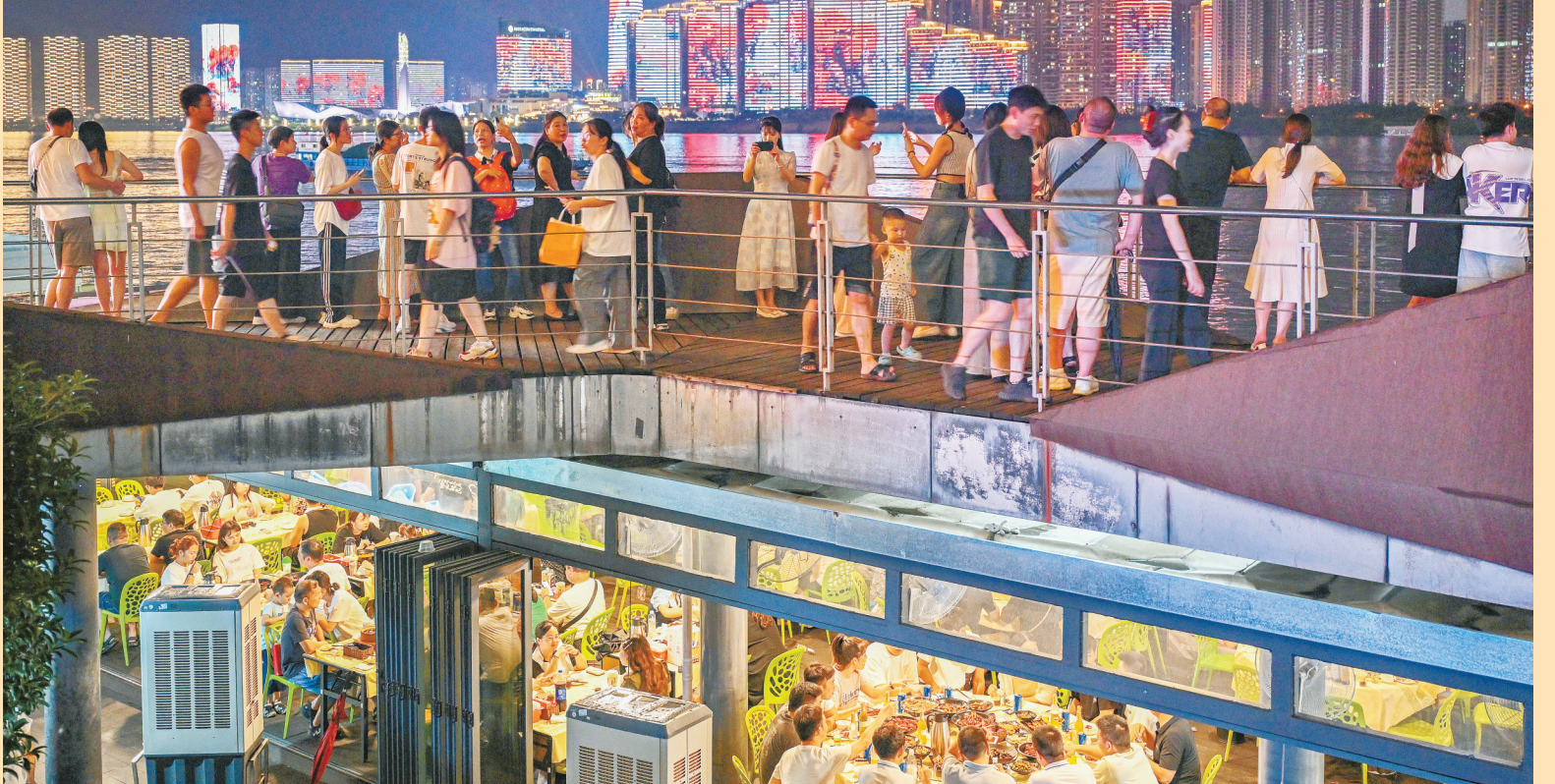
8月12日晚,长沙市渔人码头热闹非凡,烟火气十足,吸引众多食客前来打卡。湖南日报全媒体记者 郭立亮 摄