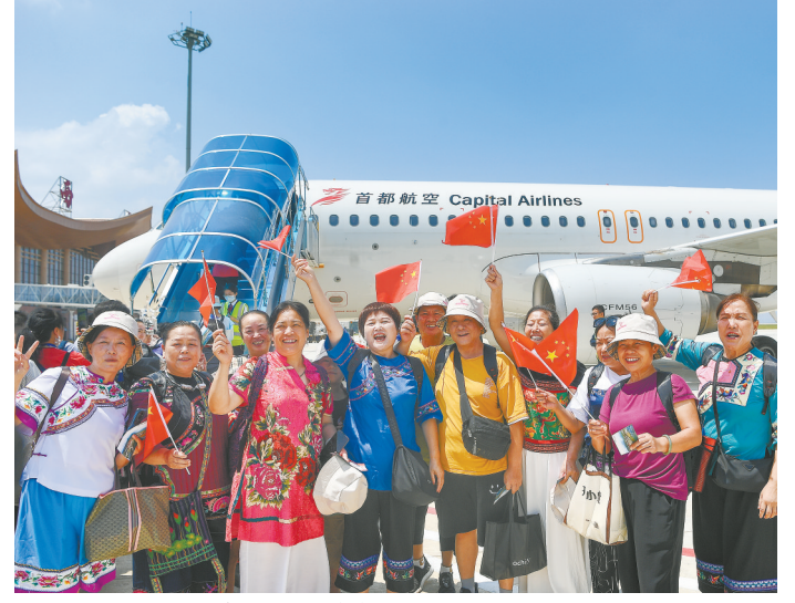
8月18日,旅客在起飞前合影。当天,湘西土家族苗族自治州边城机场举行通航仪式,标志着湘西州正式进入航空时代。湖南日报全媒体记者 傅聪 摄