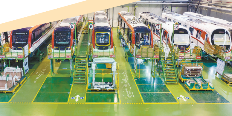
2月14日,中车株洲电力机车有限公司城轨事业部总装车间,技术人员在组装城轨车辆。

10月,2023年深入学习贯彻习近平生态文明思想研讨会在长沙举行,贯彻全国生态环境保护大会精神,深入开展理论研讨和实践交流。湖南深入学习贯彻习近平生态文明思想,以生态优先、绿色发展为导向,持续改善生态环境。1至11月全省空气质量优良天数占比91.0%,同比上升2.7个百分点;1至11月地表水国家考核断面优良率98.6%,与上年保持同等水平;生物多样性保护步入新时代,新增123种省级重点保护野生动物……“人与自然和谐共生”的美景生动展现,美丽湖南建设迈出重大步伐。全省政协系统开展改善生态环境专项民主监督,取得良好效果。