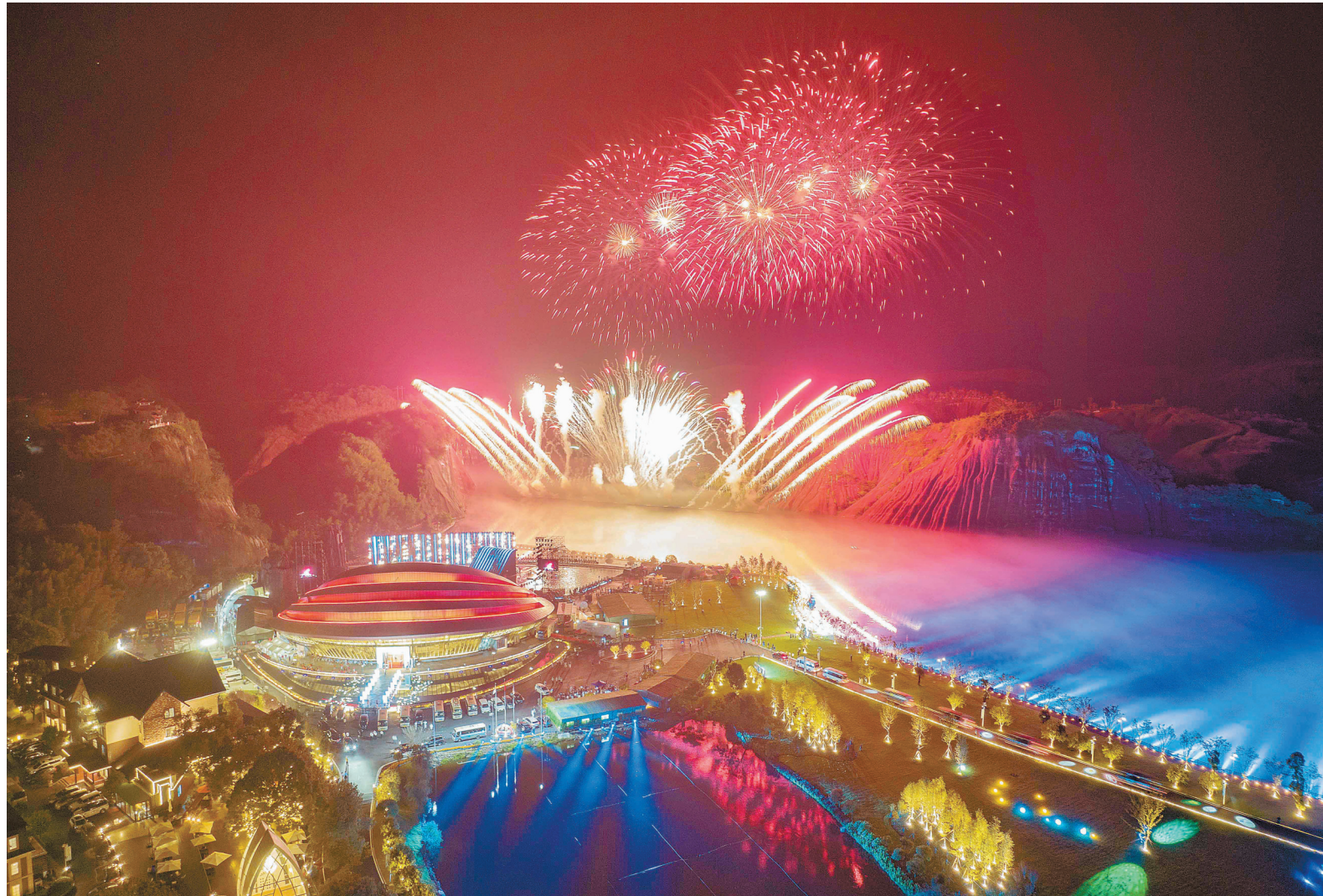
9月16日晚,郴州市飞天山演艺中心,第二届湖南旅游发展大会开幕式现场。