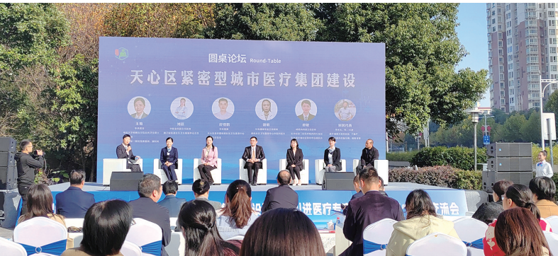
11月28日，天心区柔性引进医疗专家团队工作室成立一周年之际，举办“天心区—长沙市第三医院紧密型城市医疗集团建设暨柔性引进医疗专家团队工作室”成果交流会，图为论坛环节。

“三甲医院有技术、有人才、有资源，基层医疗机构‘求贤若渴’，双方合作成就了一场双向奔赴。”天心区卫健局负责人说。 紧密型医疗集团围绕让群众“少生病，少跑腿，少负担，享健康”的目标，促进优质医疗资源下沉，实现分级诊疗，让居民在家门口享受三甲医院优质医疗服务。