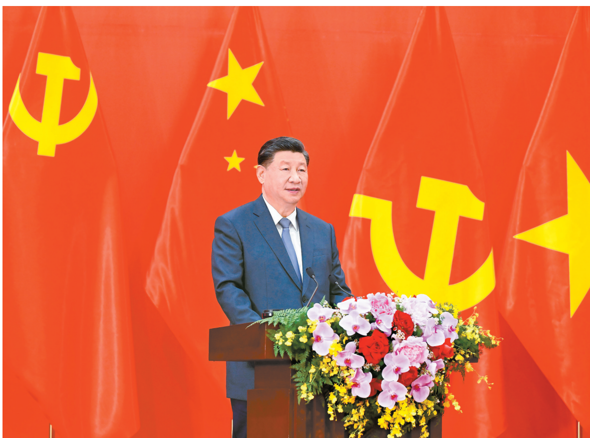
当地时间12月13日下午，中共中央总书记、国家主席习近平和夫人彭丽媛在河内同越共中央总书记阮富仲夫妇共同会见中越两国青年和友好人士代表。这是习近平发表题为《赓续传统友谊，开创中越命运共同体建设新征程》的重要讲话。

新华社河内12月13日电 当地时间12月13日下午，中共中央总书记、国家主席习近平和夫人彭丽媛在河内同越共中央总书记阮富仲夫妇共同会见中越两国青年和友好人士代表。 习近平夫妇和阮富仲夫妇同中越两国青年和友好人士代表亲切合影。 中越友好人士及青年见面会现场气氛热烈，鲜花和两国党旗国旗交相辉映，汇成一片喜悦的海洋。 在热烈的掌声中，习近平发表题为《赓续传统友谊，开创中越命运共同体建设新征程》的重要讲话。（讲话全文见2版） 习近平代表中国党和政府向致力于中越友好的新老朋友致以亲切问候。习近平指出，昨天，我同阮富仲总书记一道宣布构建具有战略意义的中越命运共同体，开启了中越两国关系发展新阶段。这是我们为振兴世界社会主义和实现中越两国长治久安作出的重大战略决策，深深植根于中越传统友好，符合两国人民共同利益和共同愿望。 回首过去，我们志同道合、守望相助。近代以来，中越两党和两国人民坚守共同理想信念，在争取国家独立和民族