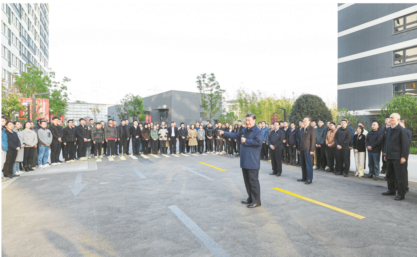
11月28日至12月2日，中共中央总书记、国家主席、中央军委主席习近平在上海考察。这是11月29日下午，习近平在闵行区新时代城市建设者管理者之家考察，同社区居民亲切交流。

新华社上海/江苏盐城12月3日电 中共中央总书记、国家主席、中央军委主席习近平近日在上海考察时强调，上海要完整、准确、全面贯彻新发展理念，围绕推动高质量发展、构建新发展格局，聚焦建设国际经济中心、金融中心、贸易中心、航运中心、科技创新中心的重要使命，以科技创新为引领，以改革开放为动力，以国家重大战略为牵引，以城市治理现代化为保障，勇于开拓、积极作为，加快建成具有世界影响力的社会主义现代化国际大都市，在推进中国式现代化中充分发挥龙头带动和示范引领作用。