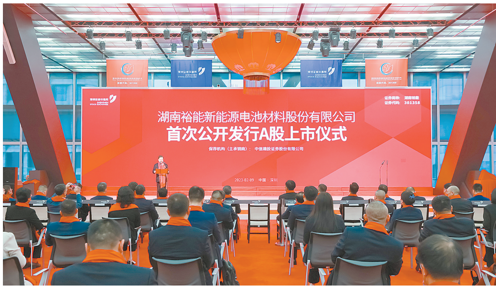
2月9日,湖南裕能新能源电池材料股份有限公司在深交所举行上市仪式。

眼下,A股实施全面注册制已有大半年,和核准制排队时长相比,注册制主板企业IPO排队时长大幅缩短,拟IPO公司最快21天过会。