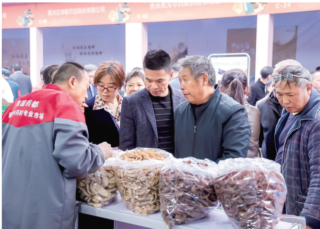
11月10日至12日，首届湖南(廉桥)中医药产业博览会在邵阳市举行。图为博览会现场。

经过前期深入交流和洽谈对接，邵阳市人民政府与湖南中医药大学签订战略合作框架协议，各县市区(园区)、企业、院校签订产业合作、校企合作项目29个，签约金额22.65亿元。其中，邵东