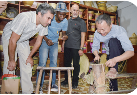
永顺非物质文化遗产竹编吸引国际友人驻足。

十年来，永顺县干部群众上下齐心，同向发力，始终保持昂扬奋进姿态，一往无前擘画永顺光明未来。