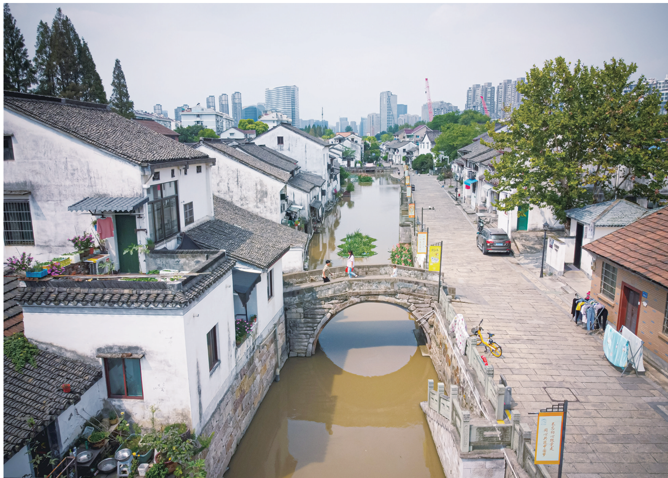
浙东运河西起杭州西兴，流经绍兴，东至宁波，充分利用浙东山川形势，连通河湖、穿越阡陌、润泽沃野，滋养着两岸人民。图为从杭州西兴老街流淌而过的浙东运河（2022年9月27日摄，无人机照片）。