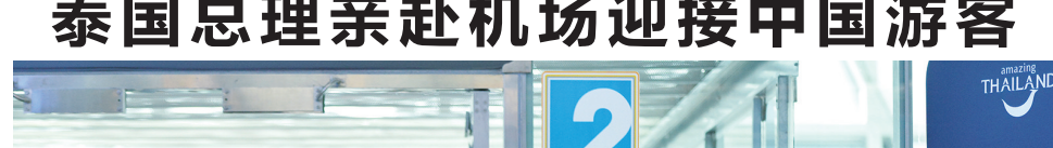
9月25日，泰国总理赛塔·他威信（前排左四）在曼谷素万那普国际机场迎接中国游客。

据新华社曼谷9月25日电 自25日起，泰国对中国游客实施为期约5个月的免签政策。当天上午，泰国总理赛塔·他威信与多名政府高官前往首都曼谷的素万那普国际机场迎接中国游客。当天，泰国国家旅游局还在曼谷廊曼机场、