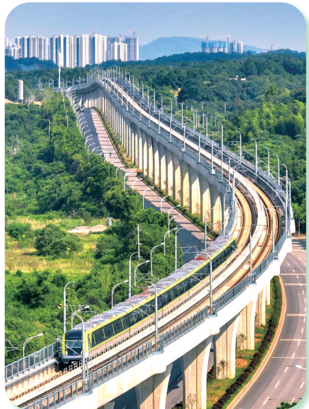
长株潭城际轨道交通西环线一期工程的开通运营,使长沙、湘潭两地进入“地铁同城”时代。