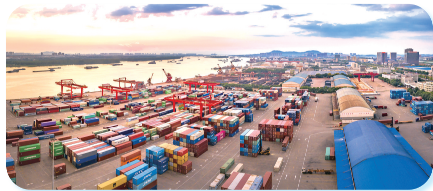
长沙新港通江达海。

串起一路风景,带动一片产业,造福一方群众。这是长沙交通建设助力乡村振兴发展的一个缩影。近年来,长沙市交通运输系统围绕“建好、管好、养好、运营好”的新要求,把握交通强国、“三高四新”美好蓝图、“强省会”战略机遇,按照省、市统一部署,以科技信息化为重要抓手,在建管养运领域持续发力,长沙市成功获评全国首批“四好农村路”示范创建突出市、湖南省“四好农村路”示范市,全市创建国家级“四好农村路”