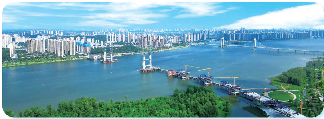
长沙兴联路大道项目有序推进。

大道行,长路写辉煌。长沙市交通运输局党组书记、局长喻志军表示,交通运输作为经济社会发展的先行官,长沙交通运输部门坚决扛牢省会责任,奋力在全省“走在前、作示范”,紧扣“大交通”“高质量”,深入推进国家综合交通枢纽中心建设,不断增强群众在交通运输领域的获得感、幸福感、安全感,为实现“三高四新”美好蓝图贡献高质量的交通运输力量。