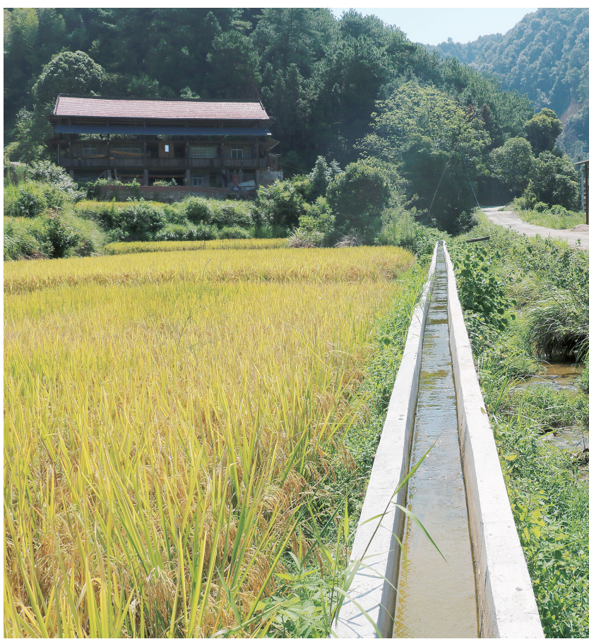
通道侗族自治县新建的水渠等小农水设施为广袤农田引来汨汨活水。

建管承诺书，压实责任。结合乡村治理“网格化”走访，派出工作队走村入户发动群众，让小农水建设和管护行动的意义和受益情况深入人心，调动村民积极性。村民由“旁观者”变为“参与者”，纷纷投工投劳参与小农水建设和管护行动。