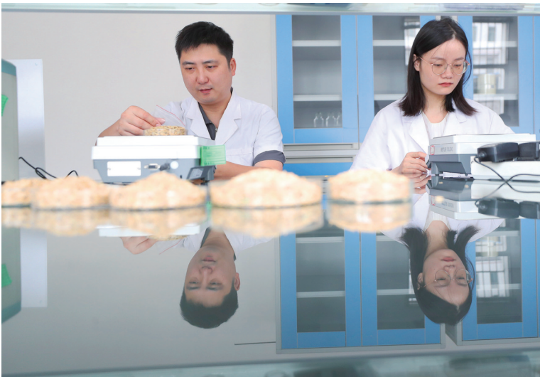
9月12日,衡南县三塘镇,湖南衡阳三塘国家粮食储备有限公司工作人员在对稻谷样本进行检测。最近,秋粮收储进入忙碌时节,衡阳市多措并举支持粮食收储企业开展收储工作,做到应收尽收。

原因何在?“老板不休假,我们打工的怎么敢奢望”“一想到要请假,就会有负罪感”……受求取不易、加班文化盛行等现实因素影响,很多人对带薪年假忧虑重重,以至于“不敢休”“不好意思休”。细思之下,这种羞于休假的理念也值得理解。毕竟,在目前的现实语境下,劳动者和用工者之间存在着不对等、不平衡性。正是这些不对等产生的顾虑,让带薪年假权利变得“可望不可即”。