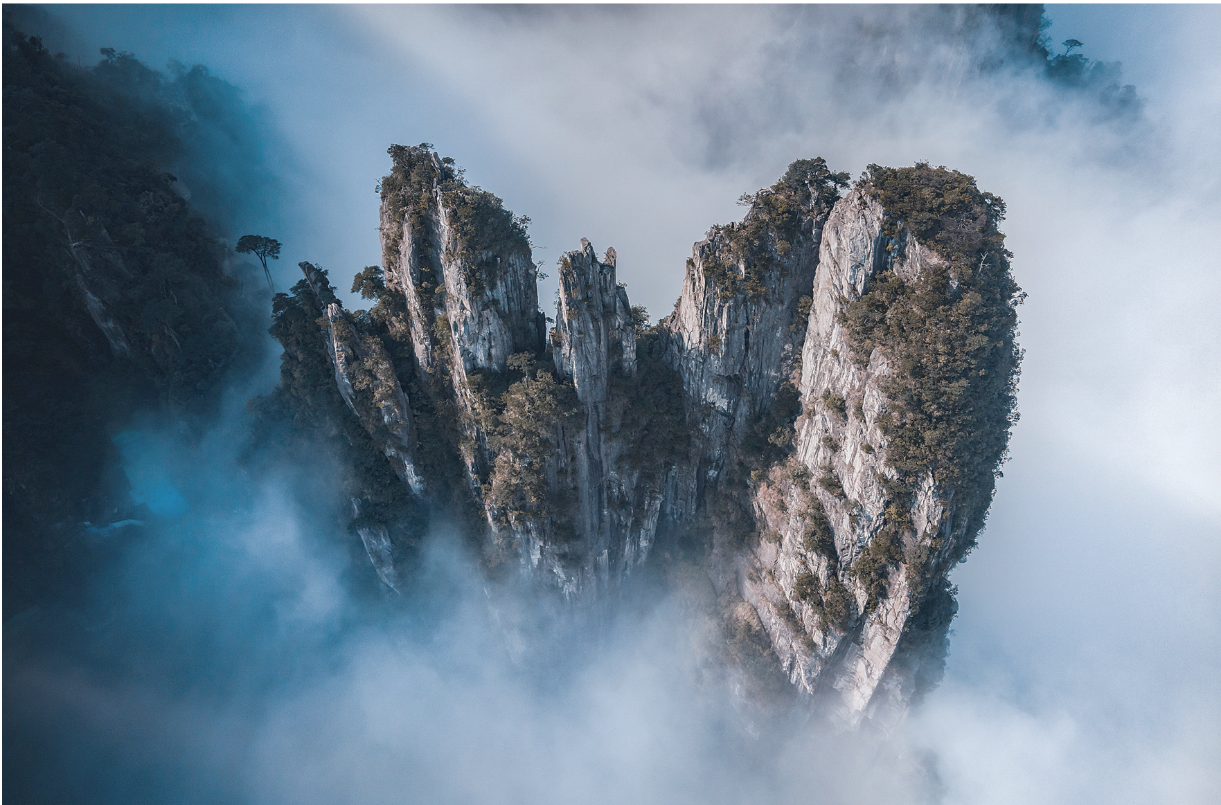
此景只应 天上有(银奖)。