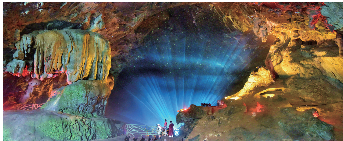
星光璀璨映仙洞(优秀奖)。