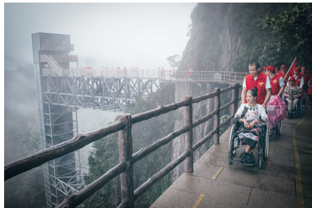
“坐”攀莽山不是梦(优秀奖)。