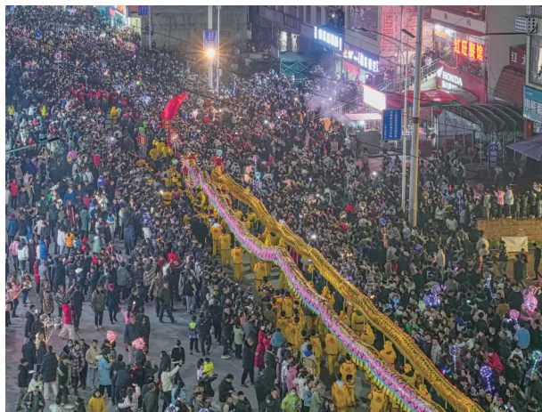
宜章夜故事 非遗闹元宵(铜奖)。