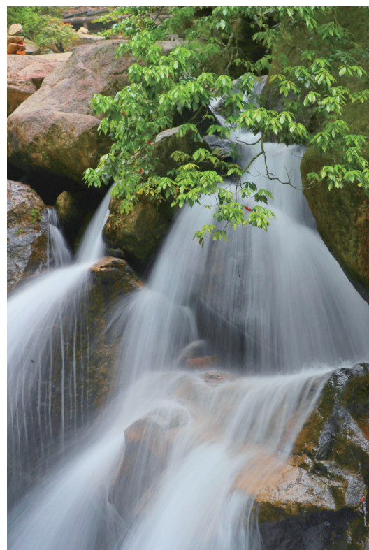
猴王寨瀑布(优秀奖)。