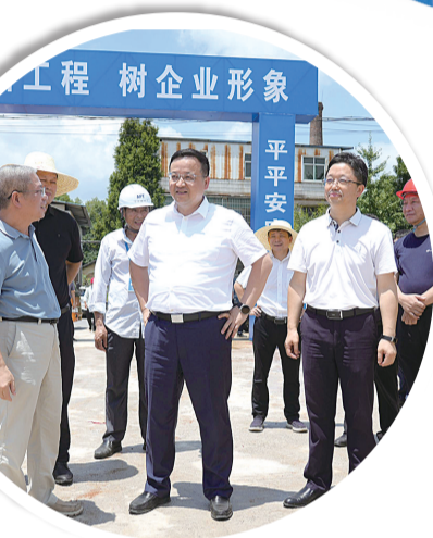
湘乡市政府主要负责人实地观摩重点在建项目。