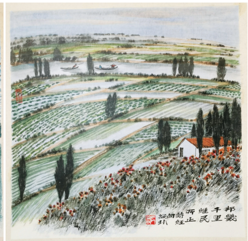
《邦畿千里,维民所止》