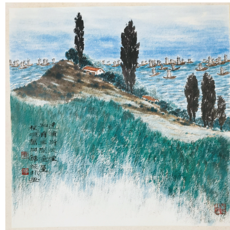
《远浦断炊烟,知有三间渔屋》

生活中,偶尔停下匆匆脚步,留出点点闲暇,唤醒记忆。湖水、湖洲、长堤、田垸、朝霞、夕阳……环湖三匝,边走边画,洞庭风物,长在我心。