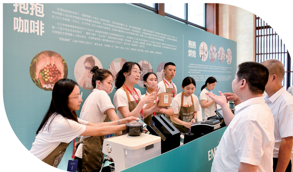
会场外,长沙市特殊教育学校展示倾力打造的“抱抱咖啡”公益计划。

分级分类开展就业培训。针对残疾人实际需求和市场需要,为10万名残疾人提供就业培训,内容涵盖新业态新技能、盲人按摩、非遗传承、农村实用技术等。