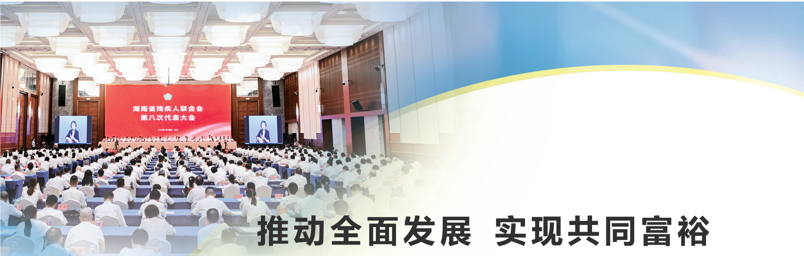
7月6日,省残联第八次代表大会在长沙开幕。