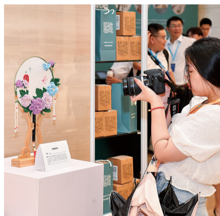
会场外展示着残疾人制作的精美手工艺品。