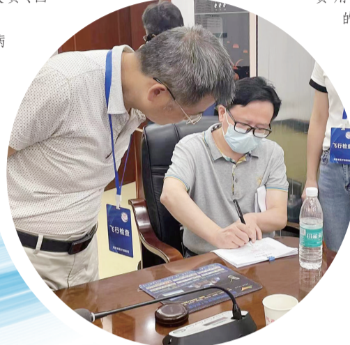
财信人寿参加湖南省医疗保障局飞行检查。