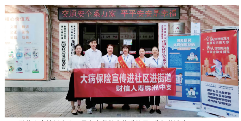
财信人寿株洲中支开展大病保险宣传进社区、进街道活动。