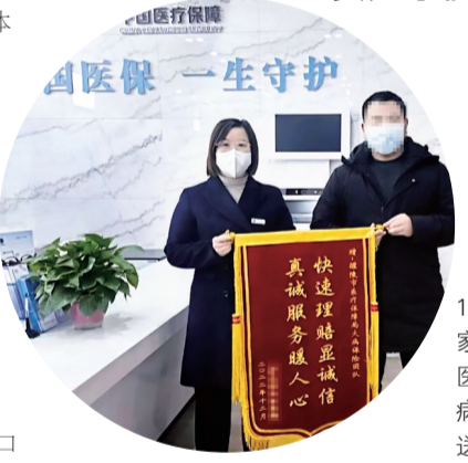
2022年12月,参保人家属向醴陵市医疗保障局大病保险团队赠送锦旗。

服务窗口,在公司内部也已经成为我们激发党员服务意识,凝心聚力提升服务水平的标志。”财信人寿大病保险业务负责人表示。