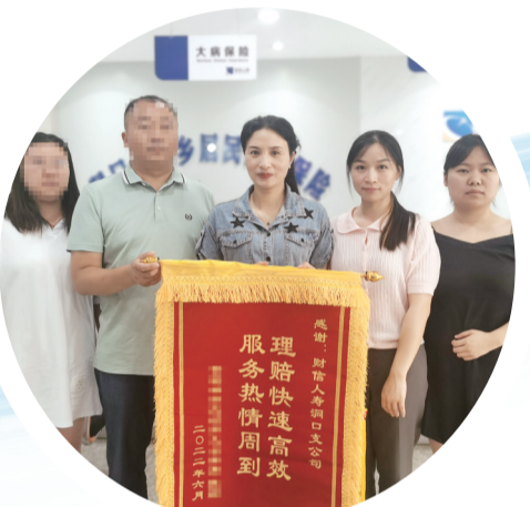
2022年6月,财信人寿洞口支公司收到参保人感谢锦旗。

立于全省,湖南自2016年开始全面实施城乡居民大病保险,平稳运行的大病保险制度,已成为我省多层次医疗保障体系的重要组成部分,亦成为我省探索保险机制参与医疗费用控制道路上的重要里程碑。