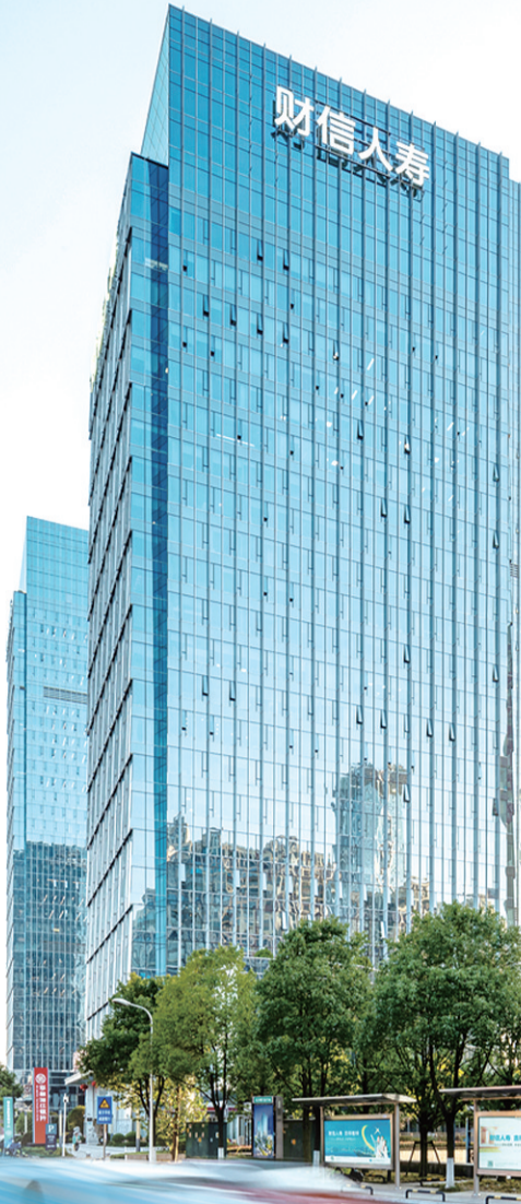
财信人寿总部大楼。