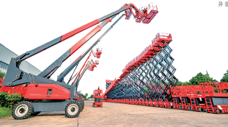
坐落于宁乡高新区的湖南星邦重工有限公司，多次突破高空作业平台同类产品世界最高纪录。