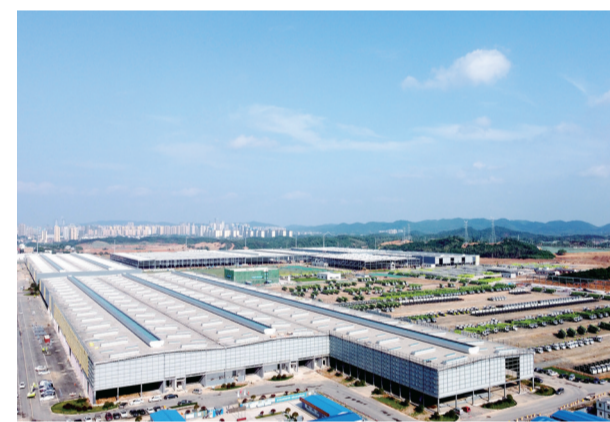
▲2022年，长沙经开区龙头铁建重工海外市场增长强劲，实现营业收入9.24亿元，同比增长512.04%。