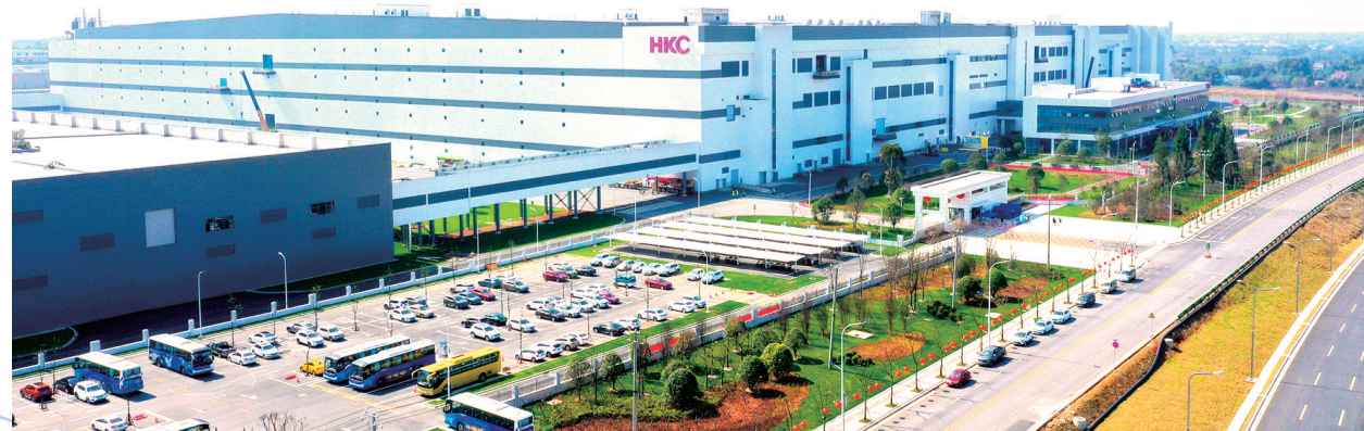
2019年，长沙惠科光电项目落地浏阳经开区，其“大尺寸超高清显示屏技术”入选2022年湖南省十大技术攻关项目。

探索带来交流，交流能碰撞出智慧火花；探索意味着实践，实践是攀登高峰的基石。向着“五好”园区目标，长沙砥砺前行！