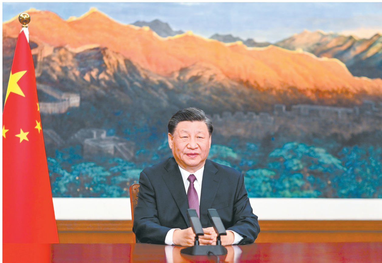
5月24日，国家主席习近平应邀以视频方式出席欧亚经济联盟第二届欧亚经济论坛全会开幕式并致辞。