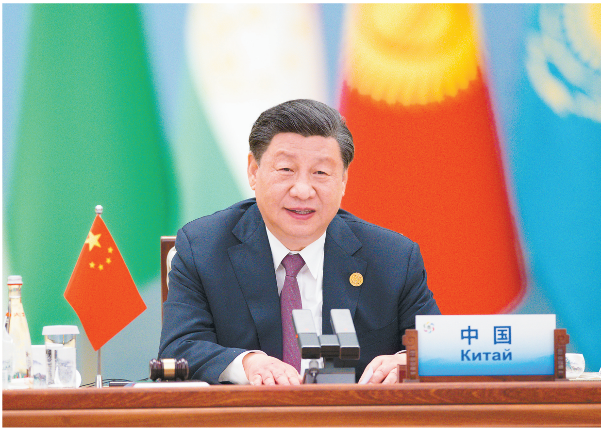
5月19日上午，国家主席习近平在陕西省西安市主持首届中国—中亚峰会并发表题为《携手建设守望相助、共同发展、普遍安全、世代友好的中国—中亚命运共同体》的主旨讲话。