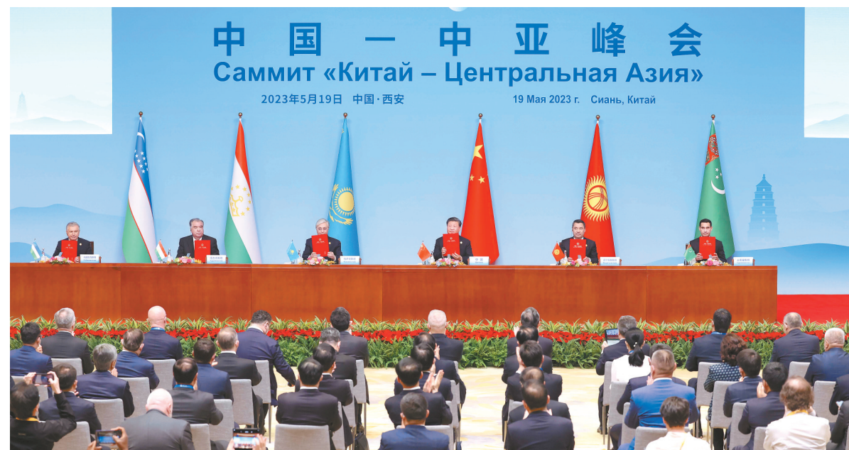
5月19日，中国—中亚峰会在西安国际会议中心成功举行，国家主席习近平同哈萨克斯坦总统托卡耶夫、吉尔吉斯斯坦总统扎帕罗夫、塔吉克斯坦总统拉赫蒙、土库曼斯坦总统别尔德穆哈梅多夫、乌兹别克斯坦总统米尔济约耶夫共同会见记者。这是习近平同中亚五国元首共同签署《中国—中亚峰会西安宣言》。

医疗卫生等领域合作，办好中国同中亚国家人民文化艺术节暨中国—中亚青年艺术节活动，推进互设文化中心，扩大人员往来，鼓励青年交流，共同实施“文化丝路”计划。中方愿继续向中亚国家青年学子提供政府奖学金名额，在中亚设立更多鲁班工坊、传统医学中心，帮助各国培养高素质人才。