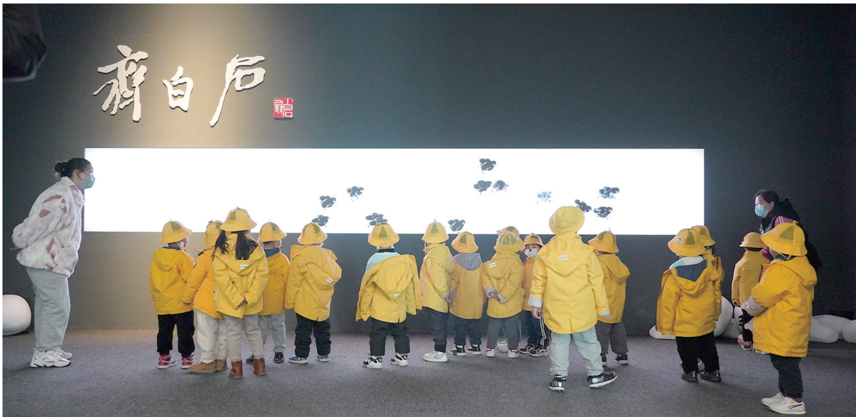
观众在湖南美术馆参观“客中月光照家山——北京画院藏齐白石精品展”。