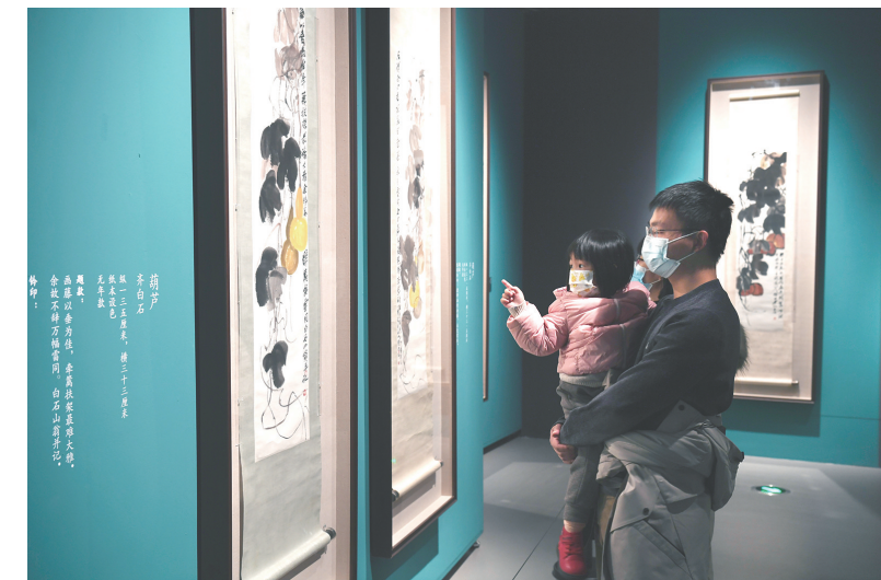
观众在湖南美术馆欣赏齐白石精品原作。

从大师光环看,齐白石是我国近现代美术史上的一代宗师。展览主题“客中月光照家山”句出齐白石印章,倾注了他对家乡的思念。99岁的艺术大师黄永玉题写展标,也为展览增添一份乡情。展览作为齐白石的“回乡展”,受到追捧,在帮助齐白石找到无数知音的同时,齐白石也成为年轻人的追星目标。