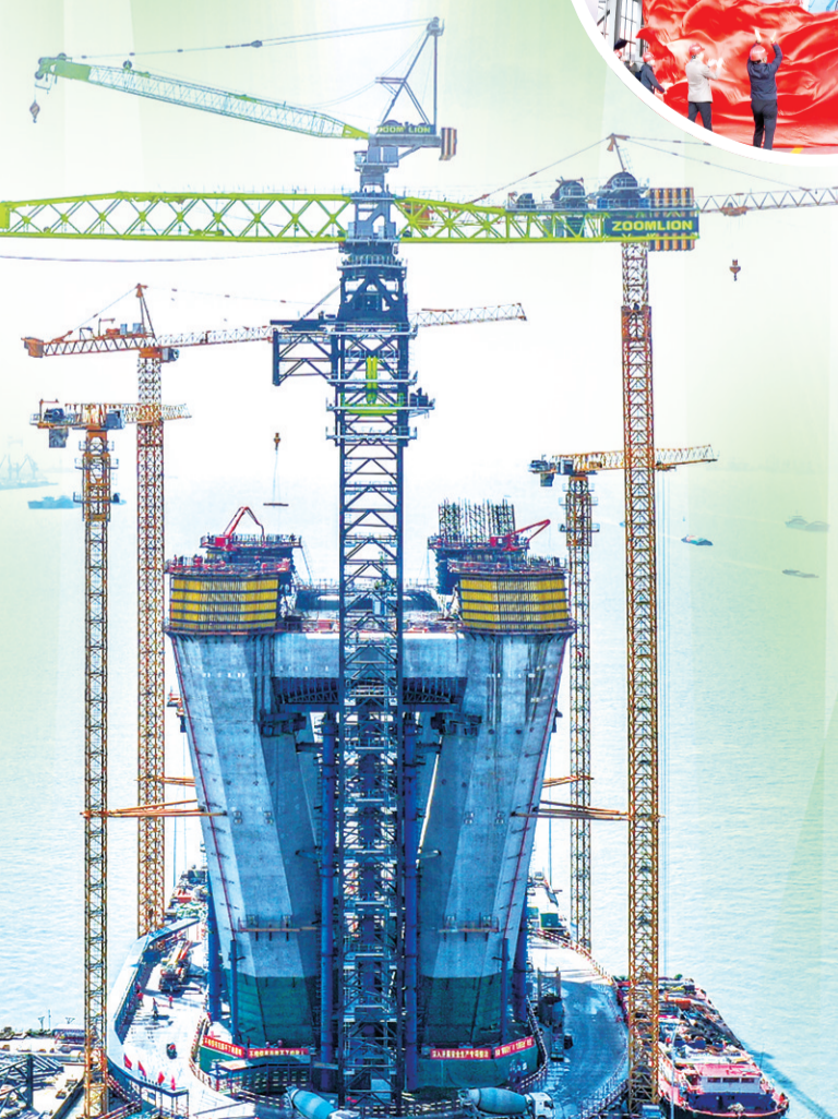
2022年，全球首台万吨米级上回转塔机进驻常泰长江大桥施工。

长沙市工信局相关负责人介绍，将来还会有更多的产业跻身“国家队”，为制造强国贡献长沙智慧。