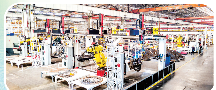
三一智能制造生产场景。

2021年以来，长沙市工信局持续推动“五链融合”。如：发挥长沙市小微企业信贷风险补偿基金、中小企业转贷引导基金和天使投资基金等“三大基金”优势，组织开展银企对接、产业链融资沙龙、投融资路演等系列特色活动，截至2022年底，长沙市小微企业信贷风险补偿基金共支持8家合作银行累计向11399家中小微企业发放信用贷款26445笔，放款金额251.05亿元；转贷基金累计服务企业838家，转贷规模153.9亿元，为企业节约转贷成本约1.38亿元，有力帮助企业破解融资难题。