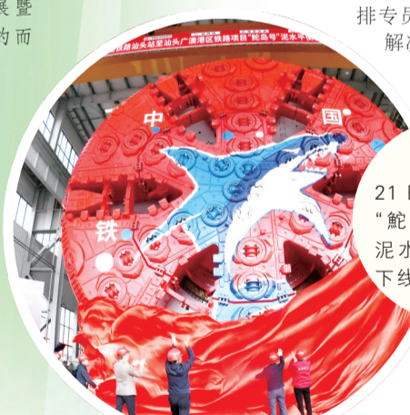
2023年2月21日，铁建重工“舵岛号”大直径泥水平衡盾构机下线。

大地升温，万物生长。3月31日，长沙市先进制造业发展暨“五好”园区创建工作推进大会如约而至。为了帮助大家更好地认识长沙制造业高质量发展的现状，感受省会实体经济发展的新趋势，我们提取了8个在工业领域被高频点击的关键词，逐一品读，以饕餮者。