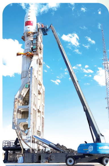
星邦智能助力国内最大的固体运载火箭“力箭一号”探访苍穹。

在全球“灯塔工厂”申报方案中，博世长沙最为打眼的当属人工智能驱动生产能源管理、机器人实时管理系统、数据智能决策、全透明的生产现场管理和端对端智慧物流中等5个应用案例。其工业4.0生产线令生产效率提高了30%，7.5秒便可生产一个ABS电机，操作人员减少80%，36道工序，39个工位，只需2个人操作，一个人负责上料，一个人负责成品质检，质量损失减少了30%，换型时间也减少了30%。