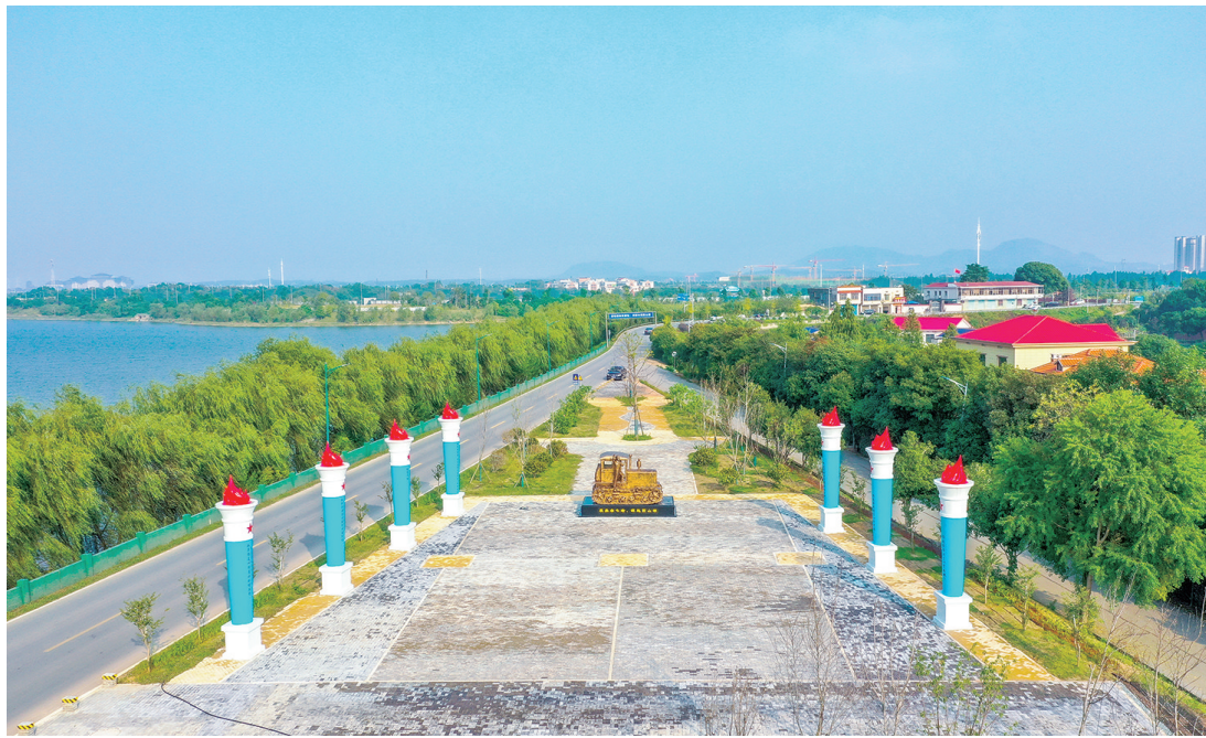
团山湖雷锋精神教育实践基地。