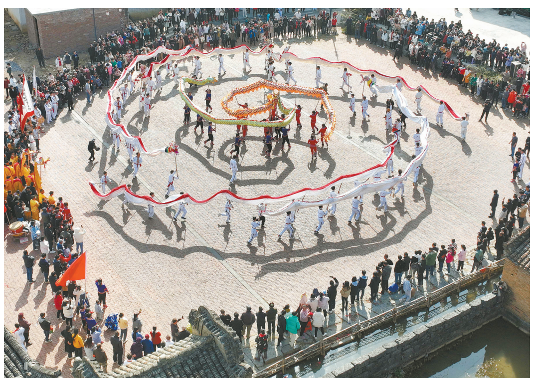
上图：1月25日，江华瑶族自治县大路铺镇神岗古村，舞龙队在村中进行舞龙表演。当天，该村村民自发组织多支舞龙队进行舞龙表演，欢欢喜喜度佳节。