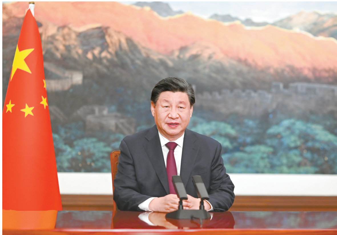
1月24日，拉美和加勒比国家共同体第七届峰会在阿根廷首都布宜诺斯艾利斯举行。应拉共体轮值主席国阿根廷总统费尔南德斯邀请，国家主席习近平向峰会作视频致辞。

习近平强调，当前，世界进入新的动荡变革期，只有加强团结合作才能共迎挑战、共克时艰。中方愿同拉美和加勒比国家继续守望相助、携手共进，弘扬和平、发展、公平、正义、民主、自由的全人类共同价值，促进世界和平与发展，推动构建人类命运共同体，共同开创更加美好的未来。