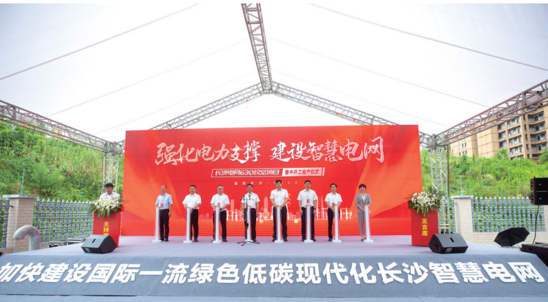
强化电力支撑，建设智慧电网。

今天，从日新月异的都市到生机勃勃的乡村，从如火如荼的项目建设现场到烟火升腾的街头巷尾，国网长沙供电公司正为长沙经济社会全面高质量发展输送澎湃动能。