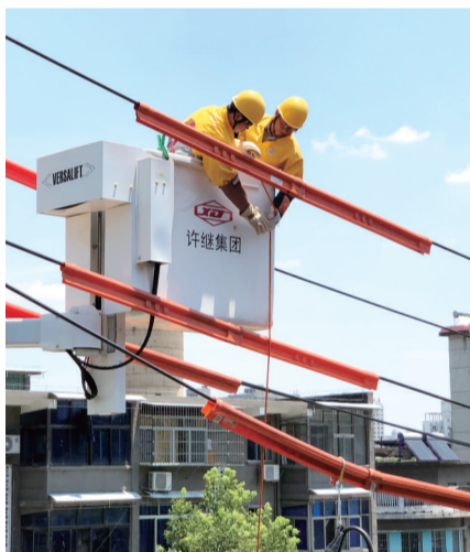
“电雷锋”战高温，保供电。

2022年，面对年初严重雨雪冰冻灾害、夏季历史罕见晴热高温，以及夏秋冬连旱灾情，国网长沙供电公司调动一切可用资源，推动源网荷储各环节协同发力，坚决守住了电网安全生命线和民生用电底线，全面打赢负荷9创历史新高迎峰度夏电力保供攻坚战，展