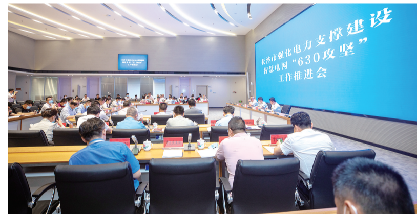
政企联动共建电网。