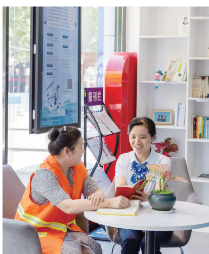
建行岳阳市分行强化大行担当，建设“劳动者港湾”为市民提供各项便民服务。

做好“建行生活”平台场景赋能，丰富属地化权益，着力打造网点一公里平台一元购、“一分乘公交”应用场景。截至2022年12月末，“建行生活”注册拉新过万。积极响应政府消费节活动，先后参与汨罗市消费节、临湘市消费节，累计实现加权交易额过亿元。