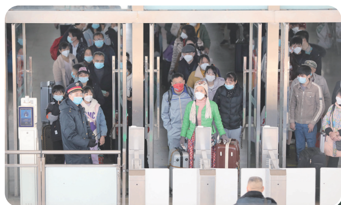
左图:1月7日,道县道州火车站候车厅,乘客准备检票上车。当天,2023年度春运大幕开启,铁路客流明显回升。