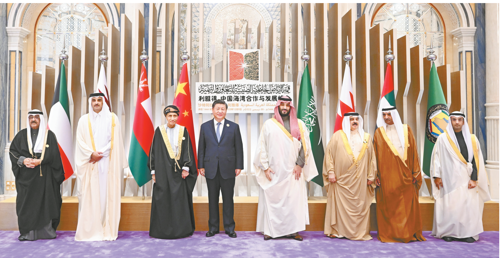
当地时间12月9日下午，首届中国—海湾阿拉伯国家合作委员会峰会在利雅得阿卜杜勒阿齐兹国王国际会议中心举行。国家主席习近平和沙特王储兼首相穆罕默德、卡塔尔埃米尔塔米姆、巴林国王哈马德、科威特王储米沙勒、阿曼副首相法赫德、阿联酋富查伊拉酋长沙尔基、海合会秘书长纳伊夫出席峰会。 习近平发表题为《继往开来，携手奋进 共同开创中海关系美好未来》的主旨讲话。