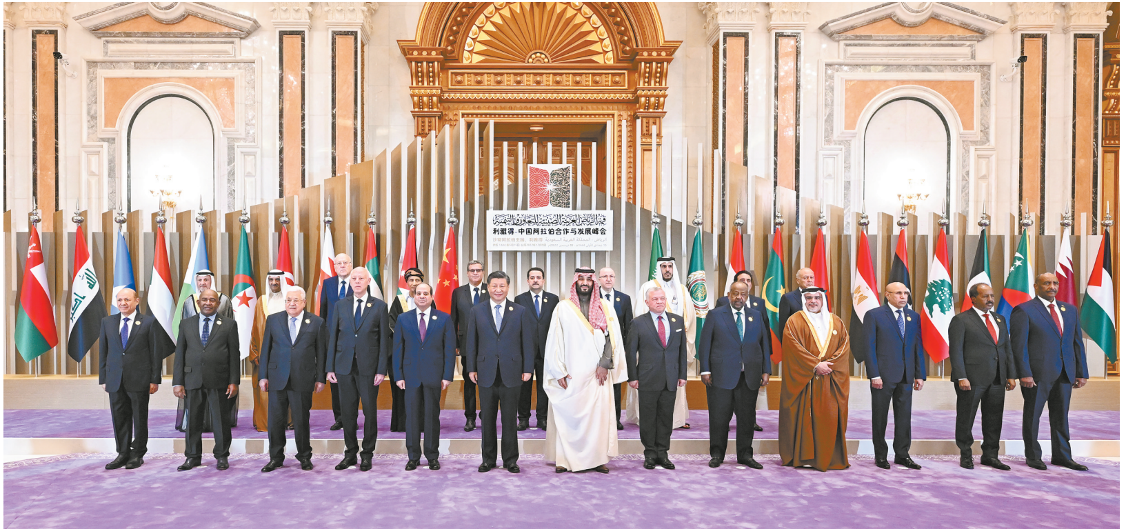
当地时间12月9日下午，首届中国—阿拉伯国家峰会在沙特首都利雅得阿卜杜勒阿齐兹国王国际会议中心举行。国家主席习近平和沙特王储兼首相穆罕默德、埃及总统塞西、约旦国王阿卜杜拉二世、巴林国王哈马德、科威特王储米沙勒、突尼斯总统赛义德、吉布提总统盖莱、巴勒斯坦总统阿巴斯、卡塔尔埃米尔塔米姆、科摩罗总统阿扎利、毛里塔尼亚总统加兹瓦尼、伊拉克总理苏达尼、摩洛哥首相阿赫努什、阿尔及利亚总理阿卜杜拉赫曼、黎巴嫩总理米卡提等21个阿盟国家领导人以及阿拉伯国家联盟秘书长盖特等国际组织负责人出席峰会。 习近平在会上发表题为《弘扬中阿友好精神 携手构建面向新时代的中阿命运共同体》的主旨讲话。