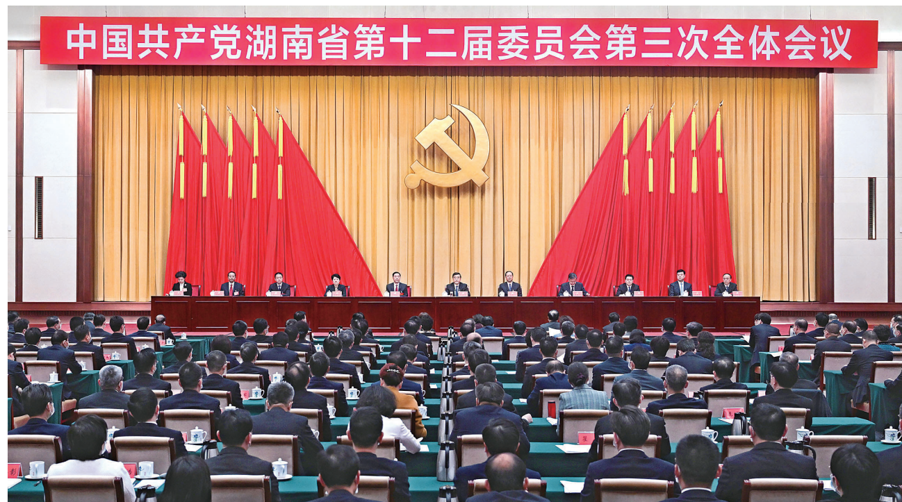
11月24日至25日，中国共产党湖南省第十二届委员会第三次全体会议在长沙召开。

全会指出，党的二十大是在全党全国各族人民迈上全面建设社会主义现代化国家新征程、向第二个百年奋斗目标进军的关键时刻，召开的一次十分重要的大会。大会取得的最重大的政治成果，就是旗帜鲜明重申“两个确立”对党和国家事业发展