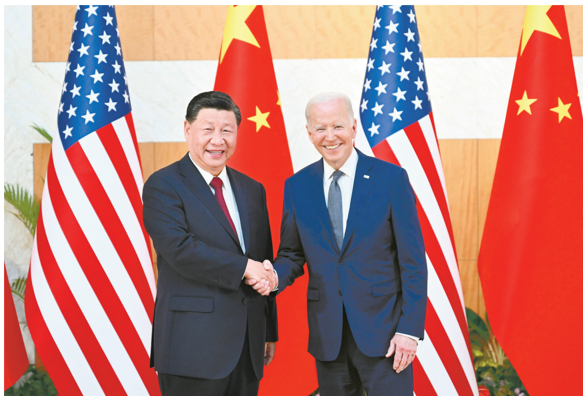
当地时间11月14日下午，国家主席习近平在印度尼西亚巴厘岛同美国总统拜登举行会晤。

新华社印度尼西亚巴厘岛11月14日电 当地时间11月14日下午，国家主席习近平在印度尼西亚巴厘岛同美国总统拜登举行会晤。两国元首就中美关系中的战略性问题以及重大全球和地区问题坦诚深入交换了看法。