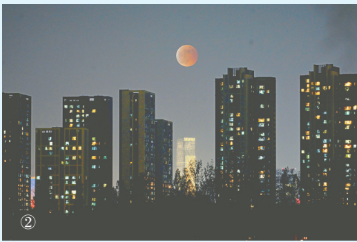
图② 11月8日晚，长沙洋湖国家湿地公园夜空中的“红月亮”。