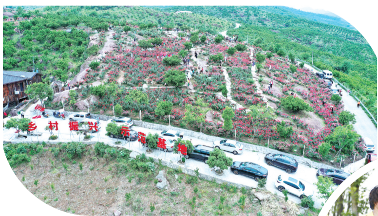
大庸所村繁花盛开。

全面加速城市有机更新,先后改造提升老旧小区89个、农村危房改造9001户,完成6个集镇提质改造工程,新建16座乡镇污水处理厂,背街小巷292条,城乡集贸市场39个,一批城市