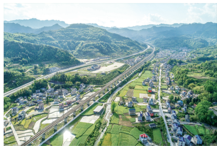
张桑高速、黔张常高铁、张桑公路横穿张家界永定区桥头乡熊家湾村。