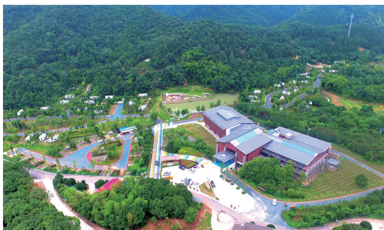
休闲度假胜地——途居昭山国际房车露营地。

在文化旅游产业方面，拥有昭山风景区、盘龙大观园、昭山城市海水上乐园3个国家4A级景区和1个省级森林公园，昭山国家级文化产业示范园区拥有文化企业270余家，今年新引进企业75家，新增科技型中小文化企业12家；健康医疗产业方面，岳塘经开区先后引进山东威高、可孚医疗、美国新途病理、惠景生殖与遗传专科医院等项目；商贸物流及总部经济方面，拥有规模以上物流企业33家，吸引10余家电力研发企业总部入驻。