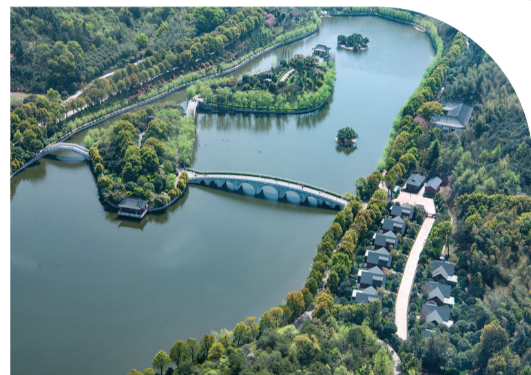
风景如画的湘潭盘龙大观园景区。