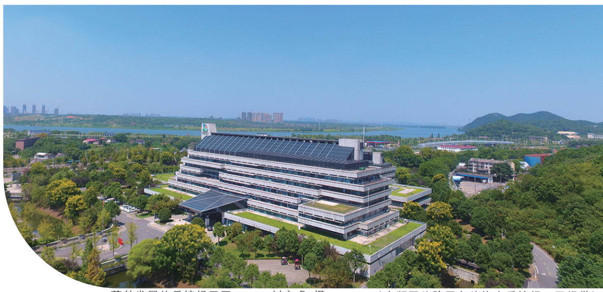
蓬勃发展的岳塘经开区。

同时，岳塘经开区还完成了岳塘区与园区政务服务两厅合一，市政府支持加大了赋权赋能力度，将涉及项目推进的9项经济社会管理权限调整为由市级直接赋权。制定《政务服务帮代办工作实施办法》，推进全程帮代办服务，变“等审批”为“送服务”。全面落实“星级管家服务”机制，确保惠企政策精准推送，进一步提高企业服务水平和质量，实现市场主体高质量发展。截至目前，包代办审批（备案）项目76个，审批项目投资总额125.8亿元。