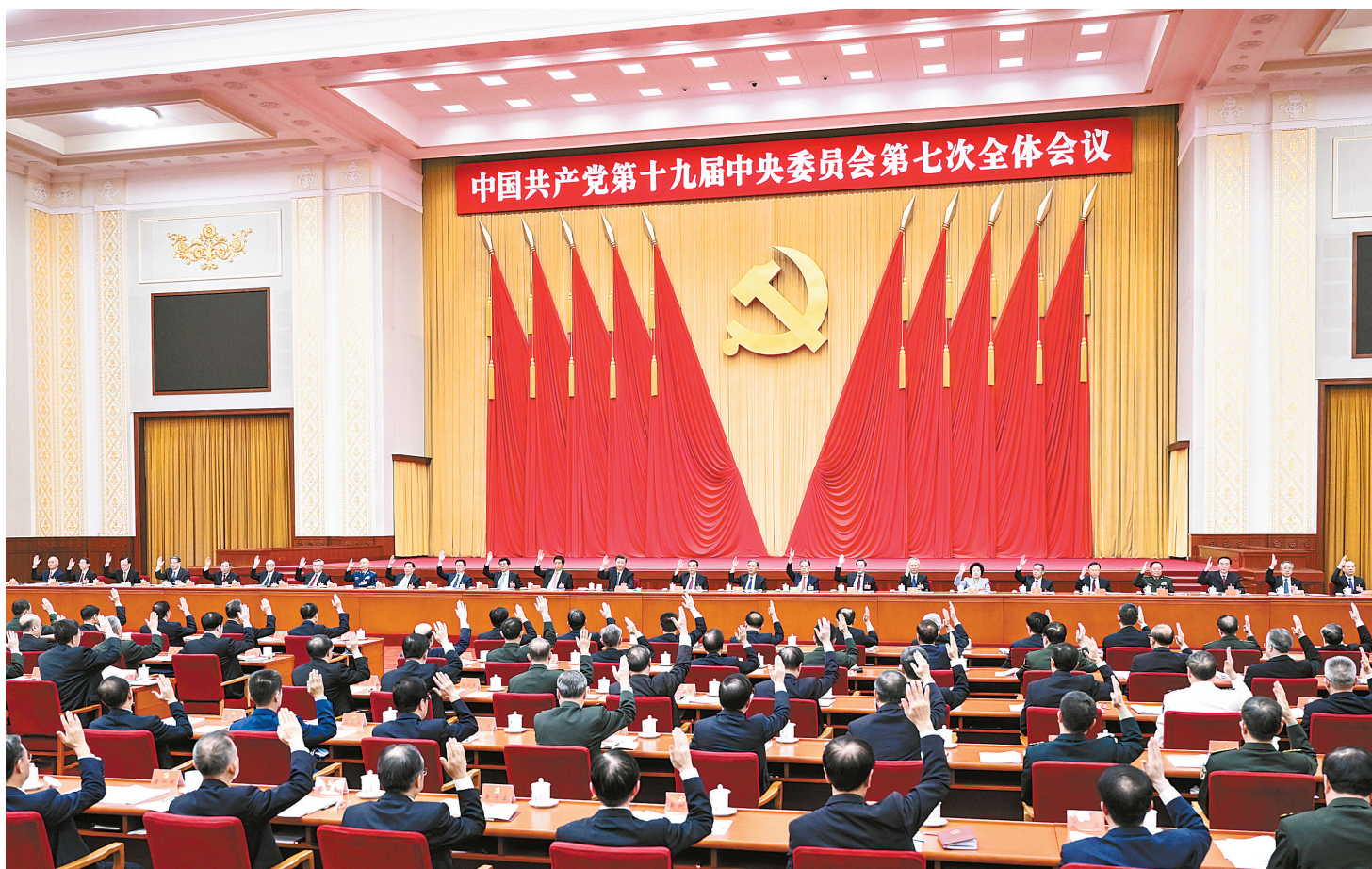
中国共产党第十九届中央委员会第七次全体会议,于2022年10月9日至12日在北京举行。中央政治局主持会议。新华社发