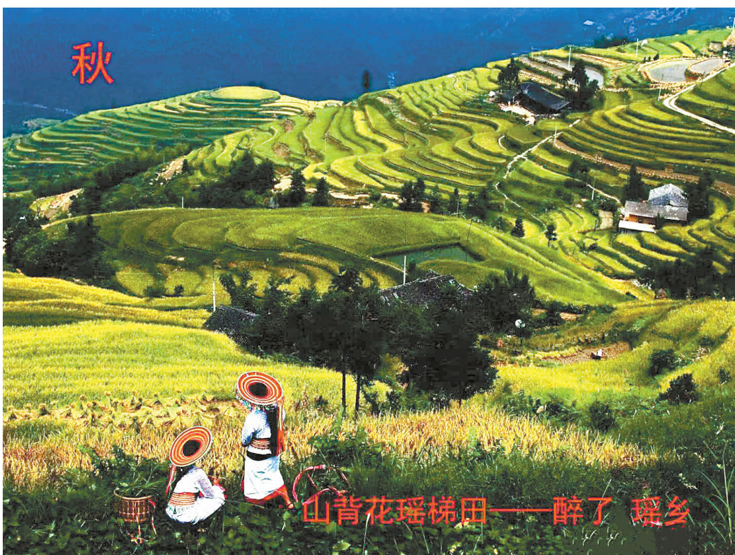
醉了，山背花瑶梯田的金秋。

去淑浦龙潭山背是我的一个夙愿。车过淑水大桥，经统溪河、黄茅园，约两小时就到了龙潭古镇。这是14年抗日战争最后一战的地方，此战是“湘西会战”中打得最惨烈的一仗，也是打败日寇的胜利收官之战。70多年前的烽火硝烟已经散去。但山背梯田的泥土芬芳却愈来愈浓，香气扑鼻。