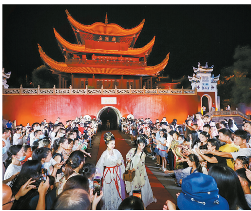
夜晚,岳阳楼旅游区游人如织。