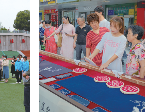
积极开展志愿服务活动,大学生志愿者走上街头,走进社区。