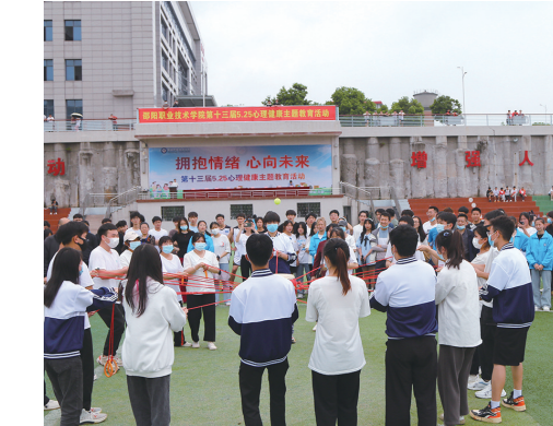
5·25心理健康主题教育活动,充实学生课余生活,培养积极向上的健康心态。

长许洪范分别带队走进工业园区、企业,打造“学院—企业—社会”联合育人模式“探路寻方”。一直以来,邵阳职院瞄准培养高素质技术技能人才、服务当地经济建设的定位,对接湘中地区先进装备制造、现代服务行业人才需求,围绕电梯工程技术、机电一体化技术等特色专业建成一批紧密型人才培养基地,形成了一线贯通,两证对接,三方共育,四环推进”人才培养模式。目前,学院共建国家级骨干专业、实习实训基地、技术协同中心,“1+X”证书试点等项目5个;立项省级一流特色专业群、现代学徒制试点建设项目8个。还与迅达(中国)电梯、广东睿昌等公司合作共建产业学院,实