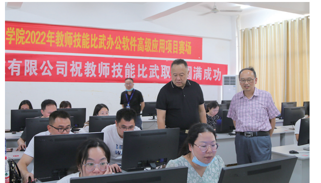
为不断提升全体教师的职业素养和教学能力,每个学年都要举行教师技能比武活动。2022年6月,学院行政领导到专业组教师技能比武现场巡查并指导。

(系、部)推荐学生代表,与教职工代表组成“大众评审团”,选出“舌尖上的美味”。这种“大众评审团”的评审模式还在学院其他民生工作中不断复制,颇受学生好评。