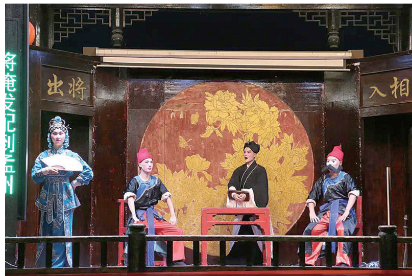
右图：7月8日，巴陵戏《打店》在岳阳楼景区上演。