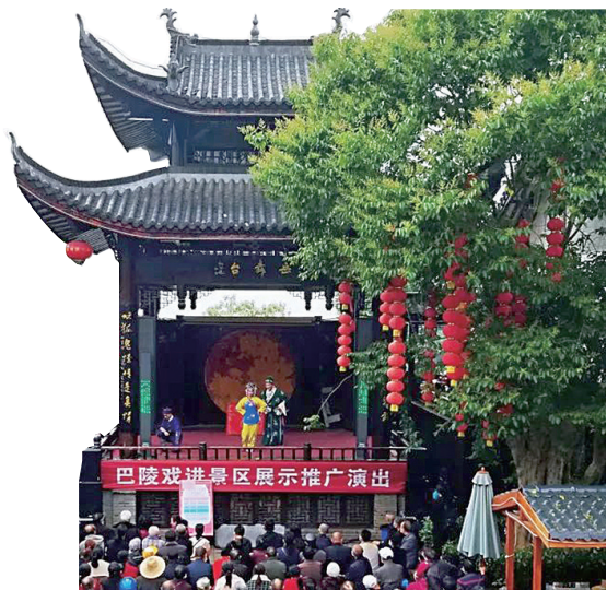
左图：巴陵戏进景区展示推广演出。